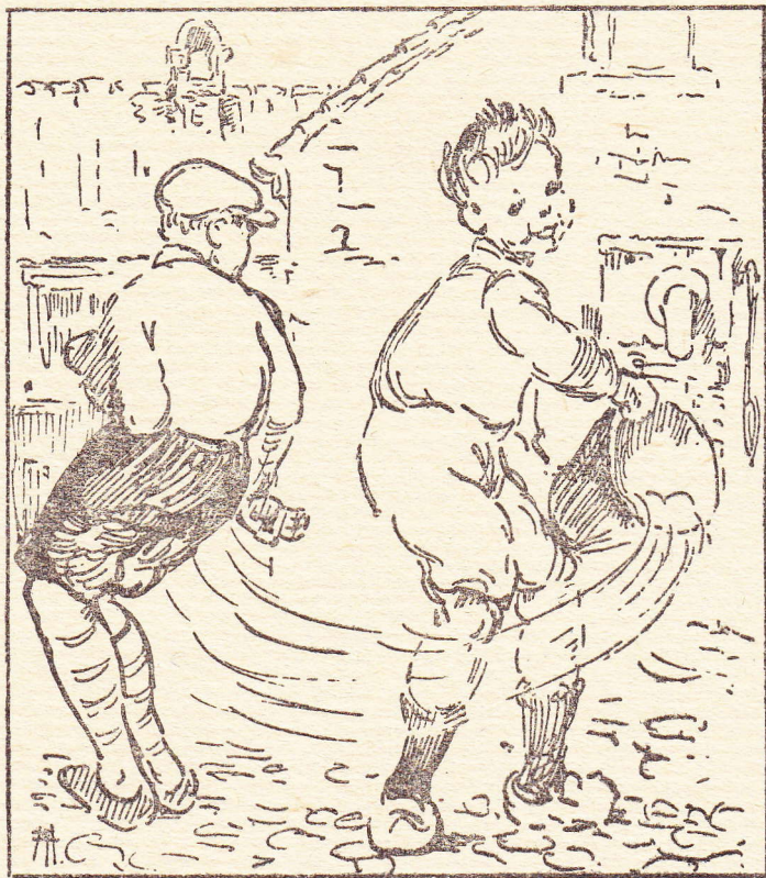
Hij goot zijnen emmer leeg tegen den plager. (blz 37)